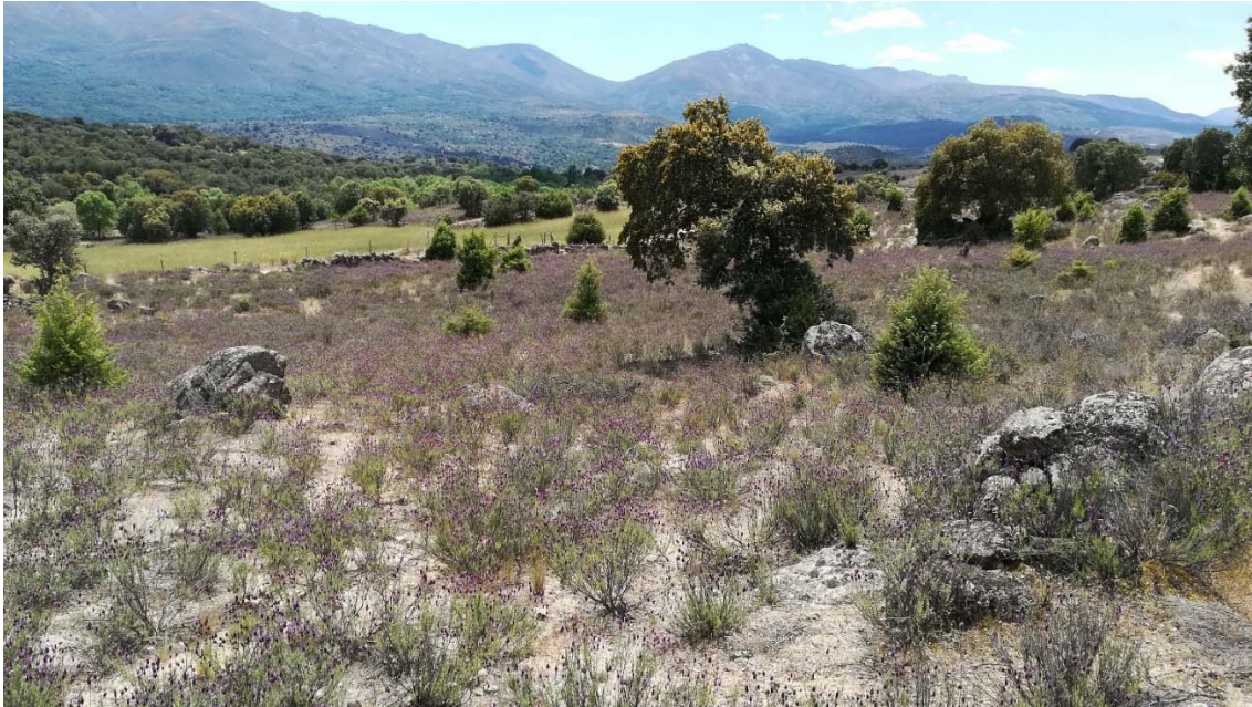
Vista desde la parte alta de una de las parcelas