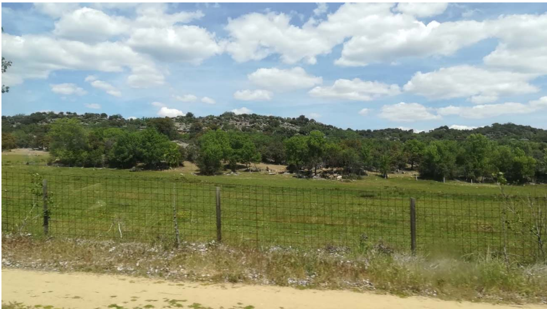
Vista desde el camino de acceso